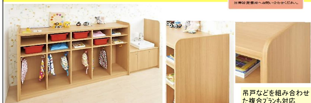
オリジナルプランの製作も可能 ※弊社営業所へお問い合わせください。