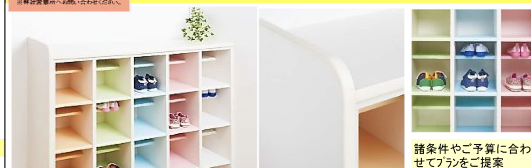
3列×5段や5列×3段などご要望に応じて製作可能 ※弊社営業所へお問い合わせください。